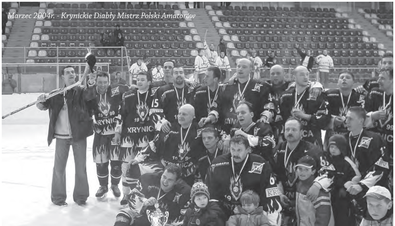
Marzec 2004r. - Krynicky Diabły Mistrz Polski Amatorów