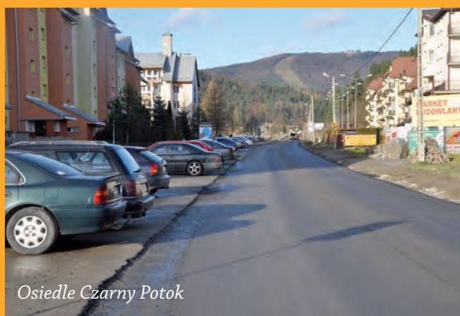
Osiedle Czarny Potok