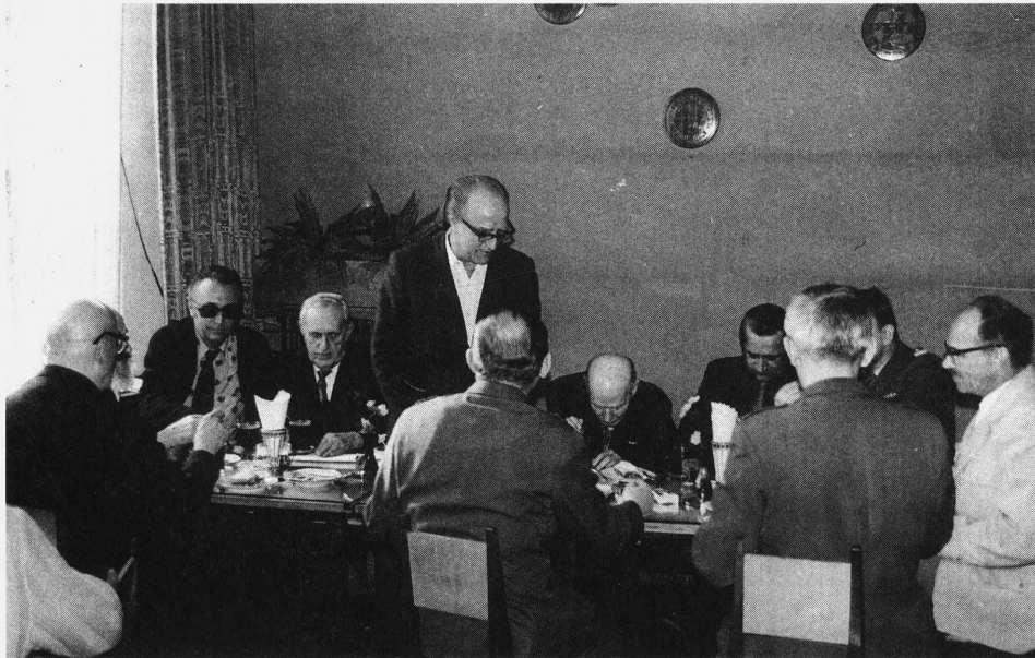
Zebrań zarządu PTTK

cy, z których dochód przeznaczony był na ten cel. Miało to powiązanie z budową Parku. Przez kilka lat, do czasu istnienia SFOS-u, zajmowaliśmy pierwsze miejsce w województwie krakowskim i w nagrodę budowa Parku Sportowego była częściowo finansowana z SFOS-u.