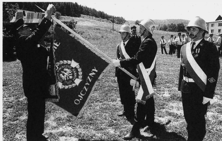
Odnaczenie sztandaru przez Słowaków

Ważnym punktem programu było podpisanie między polskimi i słowackimi strażakami umowy o współpracy