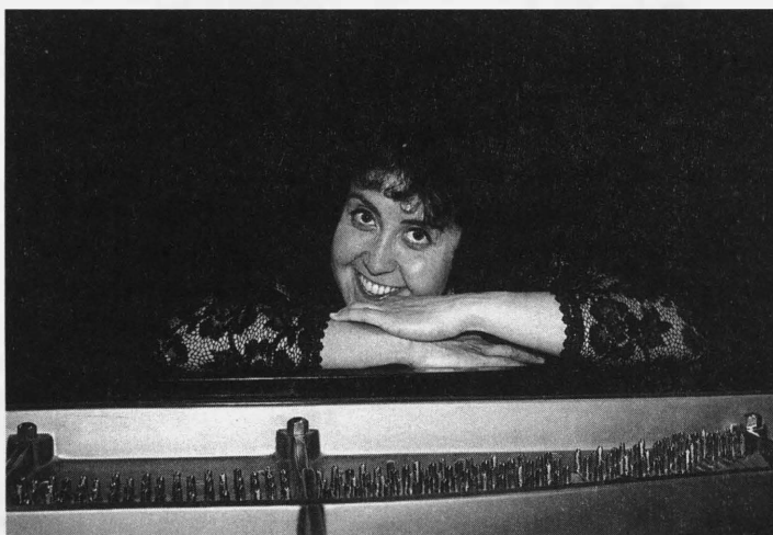
Pianistka w rozkwicie sławy

Wreszcie konkurs, który wspominam bardzo ciepło – nie tylko ze względu na to, że otrzymałam tam wysoka II nagrodę – to V Międzynarodowy Konkurs Chopinowski na Majorce. Majorka w grudniu – cudownie ciepło, gorąca spontaniczna publiczność, nagradzająca okrzykami moje występy i wizyta w klasztorze Valde-mosa, w którym Chopin spędzał zimowe miesiące 1838/39. Przy okazji wizyty – jako laureatka dopiero co zakończonego konkursu – dostałam dwóch zaszczytów: dotknięcie gołymi rękami kamizelki Chopina, w której grał jeden ze swych ostatnich koncertów oraz zagrania na Jego pianinie. Do dziś pamiętam dreszcz emocji i niezwykłości, gdy dotykałam części garderoby naszego wielkiego kompozytora.