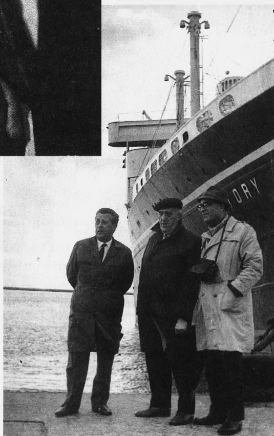
Wizyta w Gdyni

Oczkiem w głowie Doktora było wybudowanie „Parku Sportowego”. Powstał Społeczny Komitet Budowy i rozpoczął starania o zapewnienie pieniędzy na ten cel.