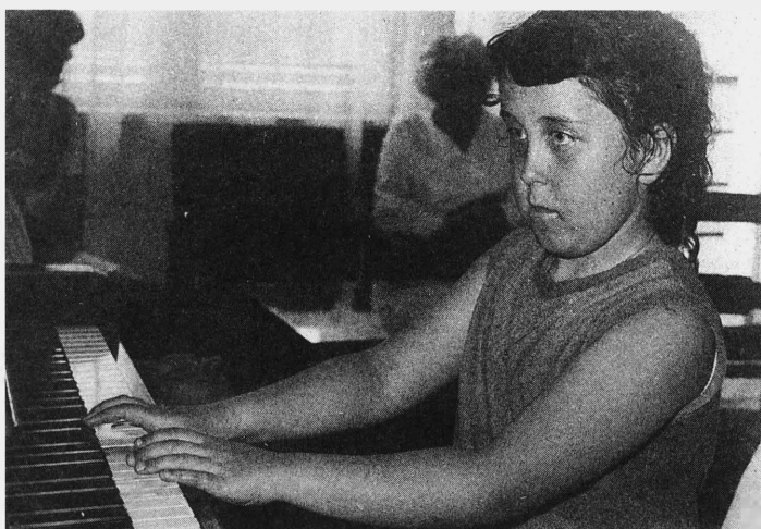
Początki edukacji muzycznej w Krynicy