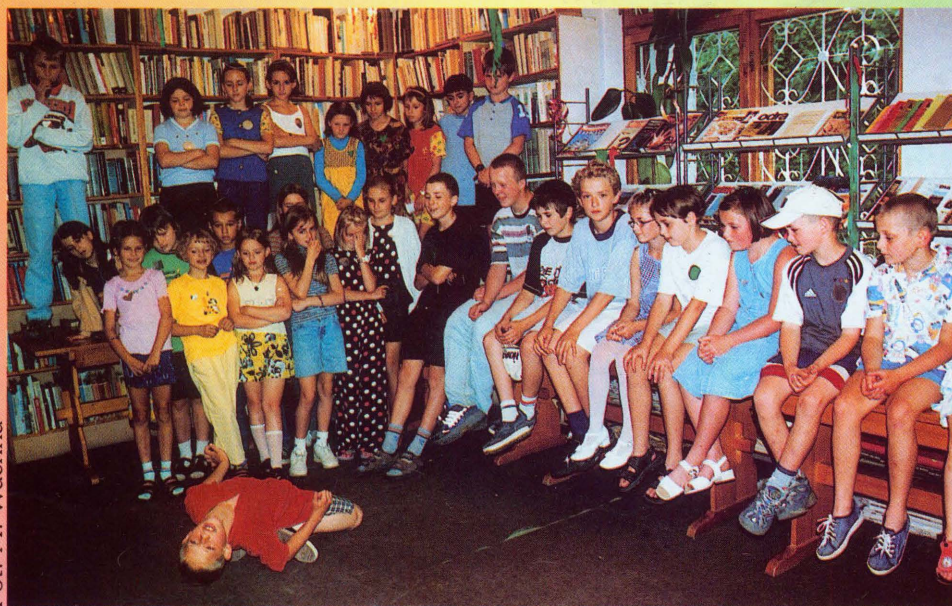
Dyskoteka w Bibliotece Centralnej

Wiele dzieci z Krynicy i okolic nigdzie nie wyjeżdża na wakacje, całe lato lub jego część spędza w miejscu swojego zamieszkania. Z myślą o nich Biblioteka Publiczna w Krynicy zorganizowała cykl różnych imprez pod hasłem „Wakacje z Biblioteką – Krynica 2000”.