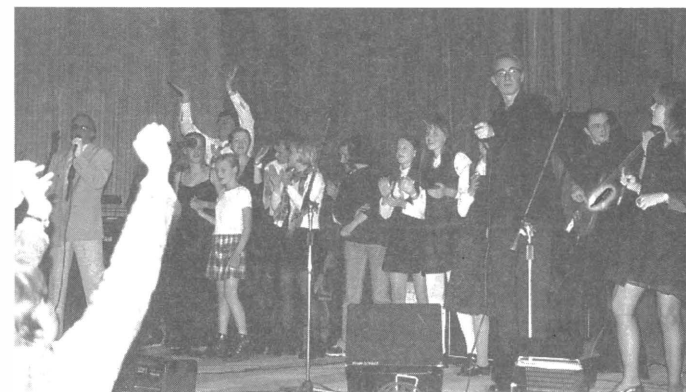
Widać, że nikt nie chce iść do domu