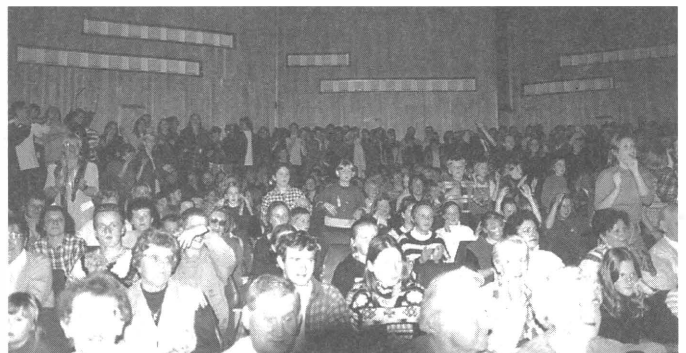
Publiczność bawiła się wspaniale. Sala była przepięwna od małych dzieci poprzez młodych ludzi aż do starszego pokolenia