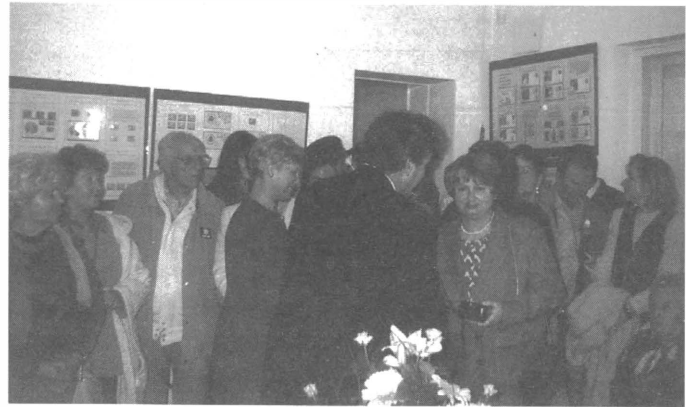
W sali wystawy