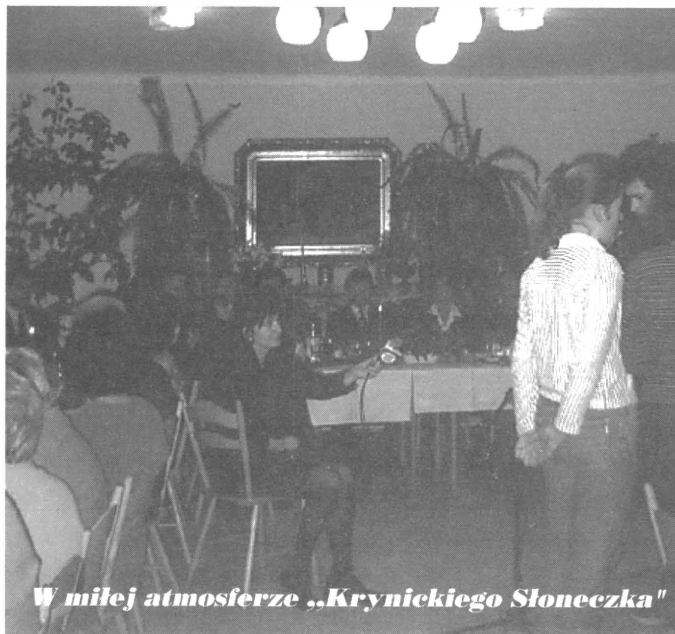
W miłej atmosferze „Krynickiego Słoneczka”