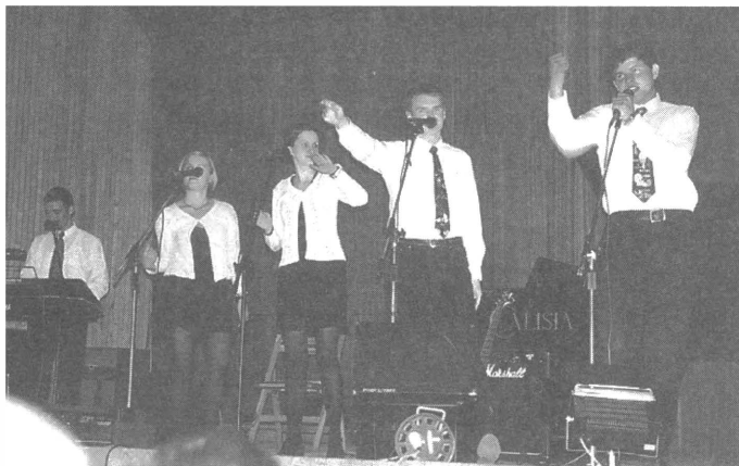
Wszystkich wspaniale rozbawiał kabaret „Granat”