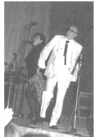
Szaleństwa na scenie