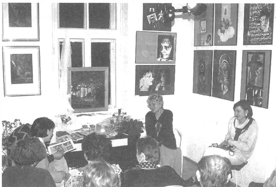
W Galerii podczas spotkania