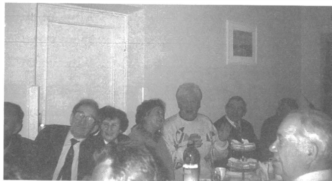
Przyjemnie jest bawić się w takim towarzystwie

Podczas spotkania odbywały się dyskusje dotyczące zbliżających się wyborów