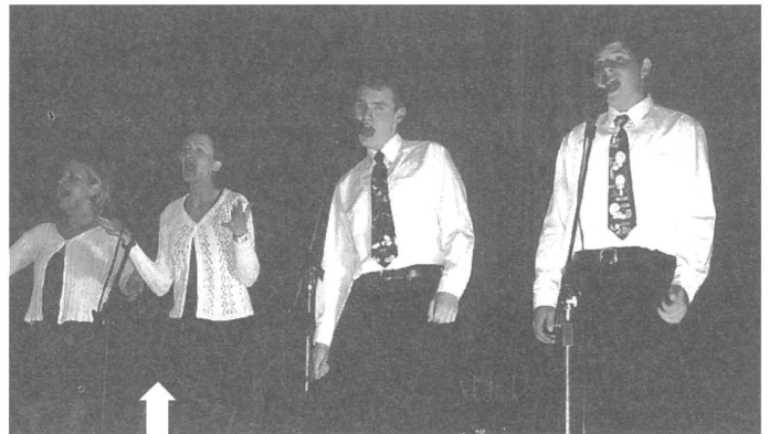
Wszystkich wspaniale rozbawiał kabaret „Granat”