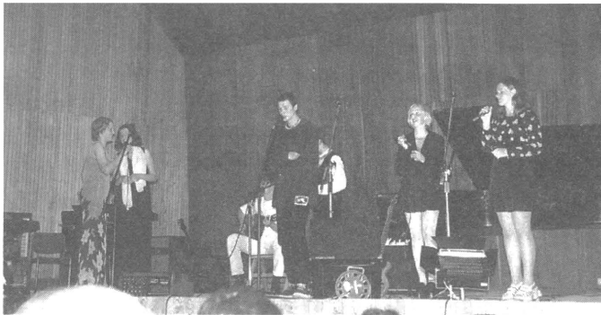
Oryginalna „Podolanka” w wykonaniu młodzieży z LO