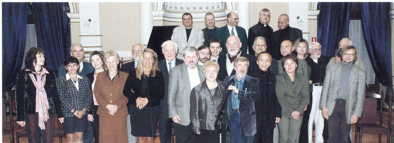
Koncert Finałowy XV Jesieni Literackiej Pogórza zatytułowany „W strofach Beskidu i Pogórza” w Sali Balowej Starego Domu Zdrojowego w Krynicy-Zdroju