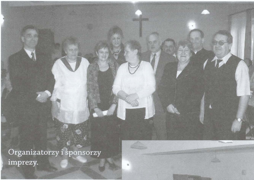
Organizatorzy i sponsorzy imprezy.

W dniu 13 stycznia 2007 r. o godz. 12.00 w nowej plebani przy ul. Czarny Potok w Krynicy-Zdroju odbył się OPŁATEK DLA SENIORÓW. To już dziesiąte jubileuszowe spotkanie opłatkowe zorganizowane przez Akcję Katolicką przy parafii p.w. Matki Bożej Nieustającej Pomocy w Krynicy-Zdroju. Dotychczasowe spotkania odbywały się w szkole podstawowej nr 2.