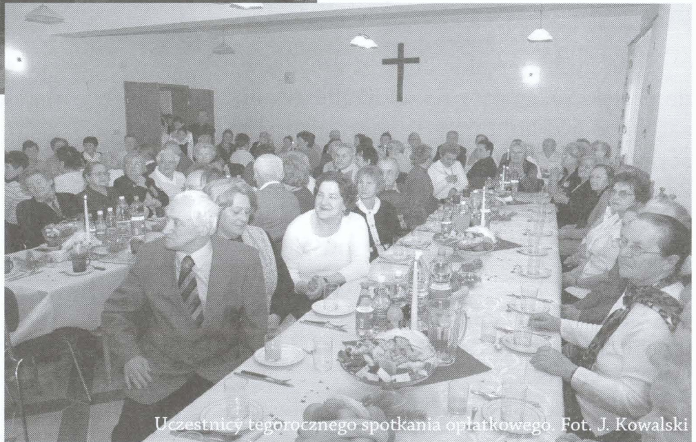
Uczestnicy tegorocznego spotkania opłatkowego.