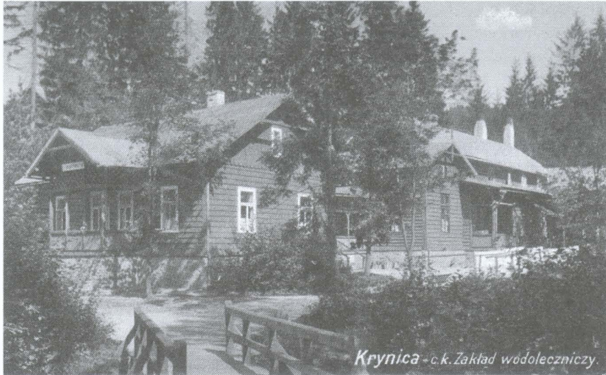
Krynica - c.k. Zakład wodoleczniczy.