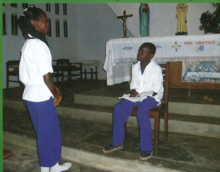
Ważnym momentem Mszy świętej jest uroczysta procesja z darami.