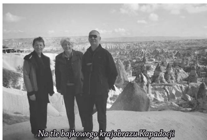
Na tle bajkowego krajobrazu Kapadocji

Program wyjazdu wypełniony był do granic możliwości, a każda minuta spędzona na zgłębianiu wiedzy o tym, mimo wszystko, egzotycznym dla nas kraju będzie procentować w przyszłości.