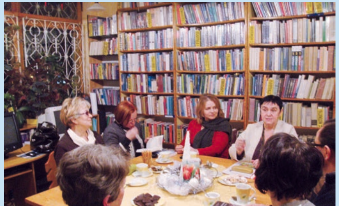
Styczniowe spotkanie Dyskusyjnego Klubu Książki.

Filie biblioteczne przygotowały w tym roku ciekawe programy zajęć dla dzieci i młodzieży szkolnej z okazji przypadających na połowę lutego ferii zimowych. Wśród propozycji znalazły się m.in.: zabawy plastyczne, projekcje filmowe, zajęcia ruchowe, zabawy karnawałowe. Dodatkowo 19 stycznia w Tyliczu odbyło się spotkanie z okazji Dnia Babci i Dziadka, przygotowane przez bibliotekę i świetlicę środowiskową „Przystań”, a także dwie lekcje biblioteczne dla uczniów szkoły podstawowej, na temat wyszukiwania informacji i zasad korzystania ze zbiorów biblioteki.