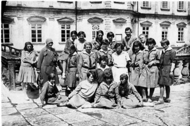
Podhorce 1931 r. Wycieczka harcerek z Seminarium Nauczycielskiego w Złoczowie.

funkcję do 1950 roku. Zorganizował jeszcze obozy harcerskie w Zarzeczcu w 1957 r. i w Gdyni-Witominie w 1958 roku, gdzie był również instruktorem terenoznawstwa. Byłam na tym obozie jako harcerka