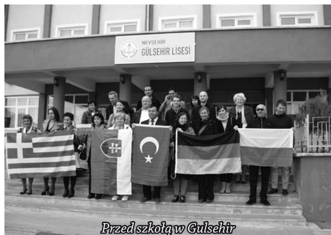
Przed szkołą w Gulsehir

W ubiegłym roku Zespół Szkół Ponadgimnazjalnych w Krynicy-Zdroju został zakwalifikowany do udziału w bardzo ciekawym i poszerzającym horyzonty projekcie Pryzmat, realizowanym w ramach programu UE Comenius. Jest to idea promująca dialog międzykulturowy, harmonię i tolerancję poprzez poznawanie kultury, religii i historii krajów wspólnie uczestniczących w owym przedsięwzięciu.