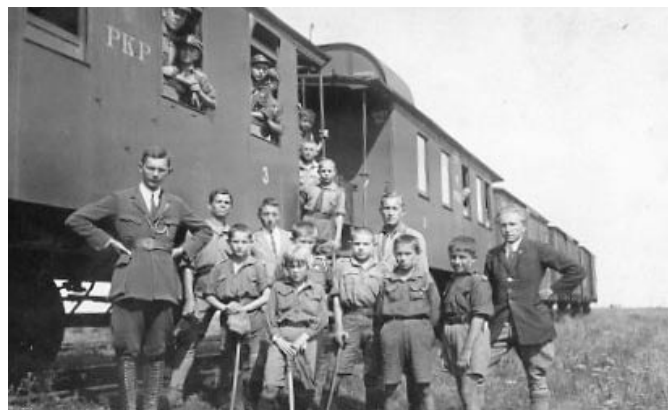
Wycieczka harcerzy złoczowskich do Krakowa w lipcu 1924 r.

znawstwa (m. in. 3-tyg. obóz letni w Gołogórach w 1932 roku, a wcześniej - jako zastępca Komendanta – obóz w Podkamieniu k. Brodów połączony z 60 km. marszem, zlot harcerski w Tarnopolu w 1930 r.) Uczestniczył również w wycieczkach szlakiem Sobieskiego do Białego Kamienia, Oleska, Podchorzec w 1931 roku, a także marsze do Zbaraża i inne.