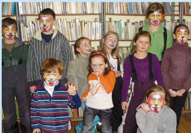
Międzynarodowy Dzień Kota w bibliotece w Tyliczu