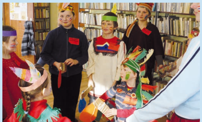
Karnawał indiański w bibliotece w Tyliczu.