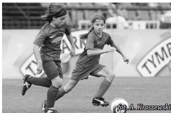
fol. A. Kraszewski

www.zpodworkanastadion.pl oraz www.uks.info.pl