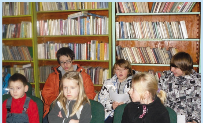
Uczestnicy seansu filmowego w bibliotece na Czarnym Potoku