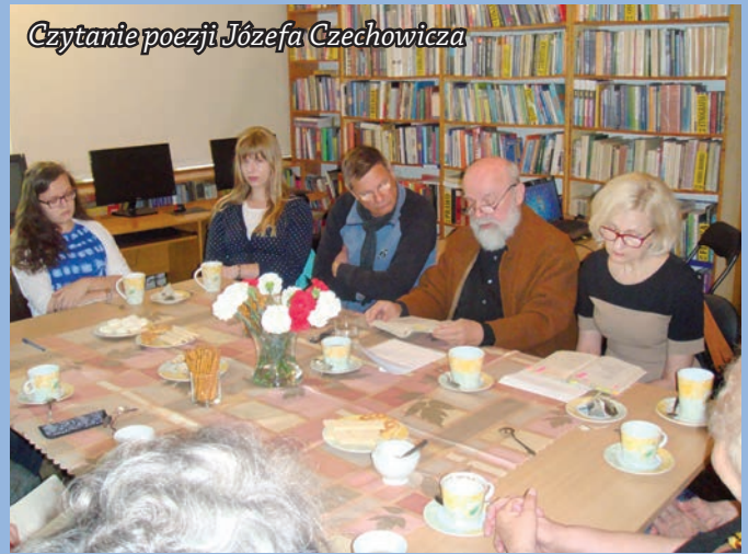
Czytanie poezji Józefa Czechowicza