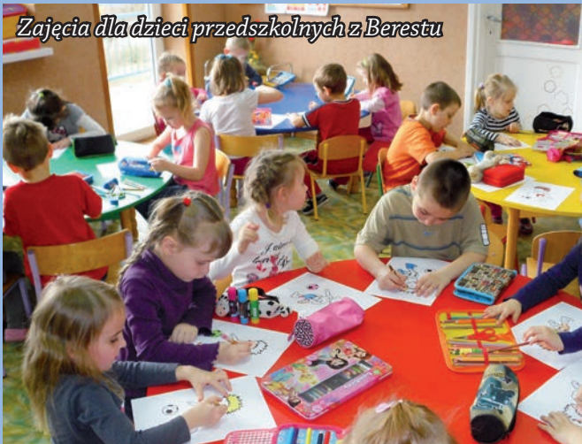
Zajęcia dla dzieci przedszkolnych z Berestu