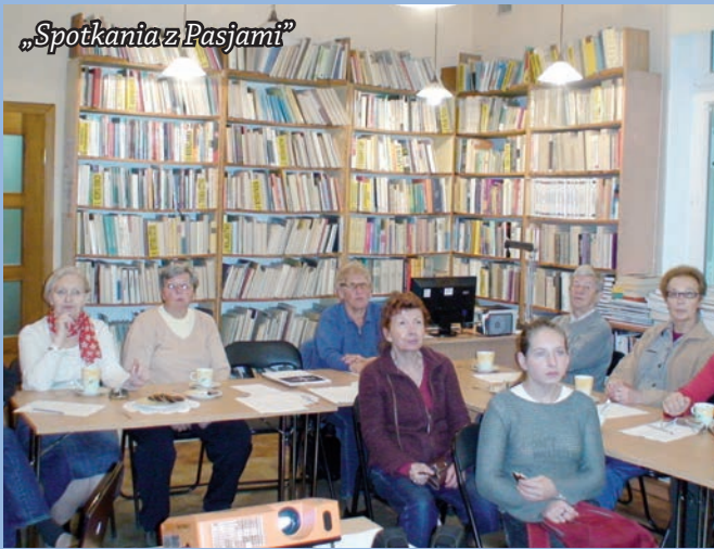
„Spotkania z Pasjami”