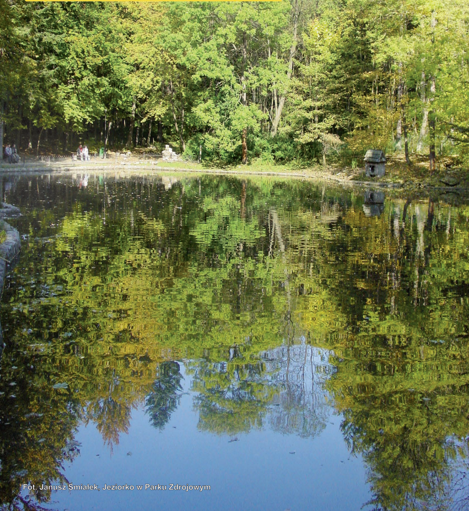
Jezioro w Parku Zdrojowym