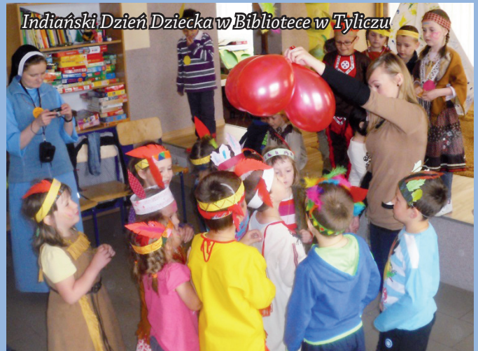
Indiański Dzień Dziecka w Bibliotece w Tyliczu