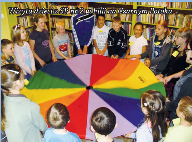
Wizyta dzieci z SP nr 2 w Filii na Czarnym Potoku