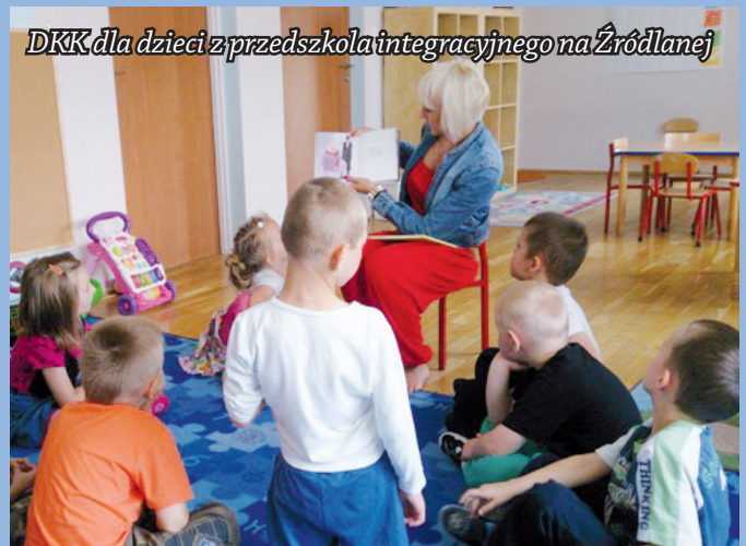
DKK dla dzieci z przedszkola integracyjnego na Źródlanej