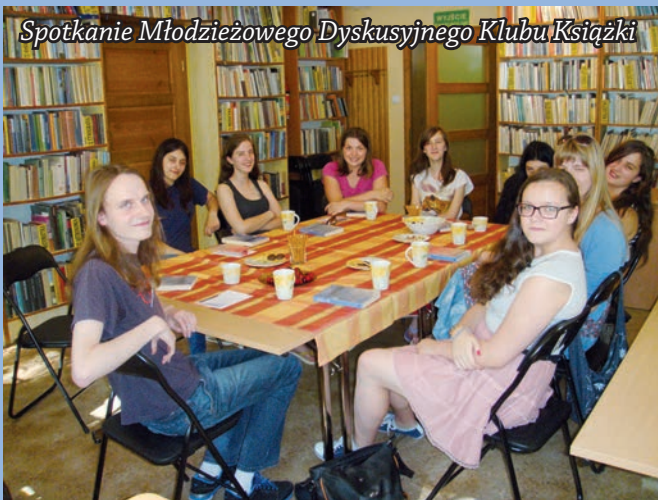
Spotkanie Młodzieżowego Dyskusyjnego Klubu Książki