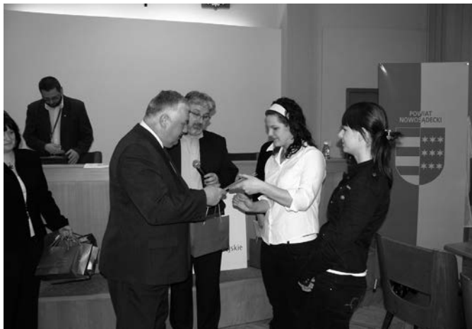
Laureaci konkursu otrzymali pamiątkowe dyplomy i upominki.

Starostwo Powiatowe w Nowym Sączu było organizatorem konkursu historycznego zatytuowanego „Żeby nie zapomnieć”, który był skierowany do uczniów szkół ponadgimnazjalnych powiatu nowosądeckiego. Zadaniem trzyosobowych zespołów było zgromadzenie pamiątek pochodzących z II Wojny Światowej: dokumentów, listów, fotografii, sprzętów itp. Do I etapu konkursu przystąpiło 20 grup z 8 powiatowych szkół, a do końcowego etapu dotarło 12 drużyn z 7 szkół.