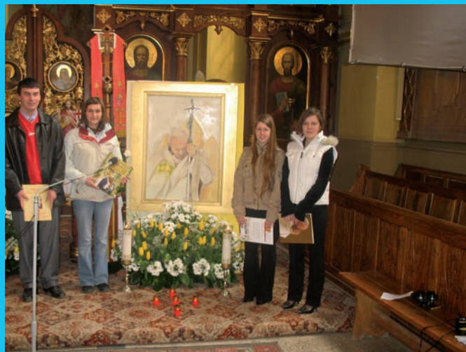
Laureaci konkursu pt.: „Dekalog w nauczaniu Jana Pawła II”.