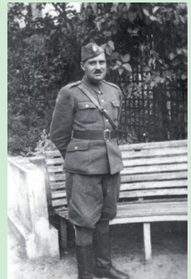
W Bydgoszczy 1945 r.