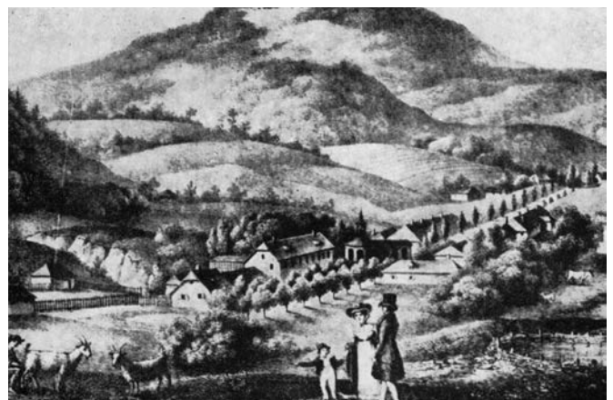
Jeden z najstarszych widoków Krynicy około 1920 roku.

Z: Stuletni jubileusz Krynicy. Kraków, w drukarni „Czasu” Fr. Kluczyckiego i sp. 1893