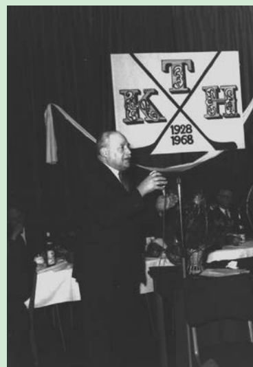
Prezes honorowy KTH