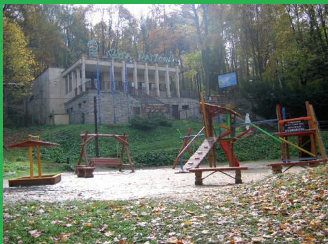
Pod dolną stacją kolejki na Górę Parkową powstał nowy plac zabaw dla dzieci.