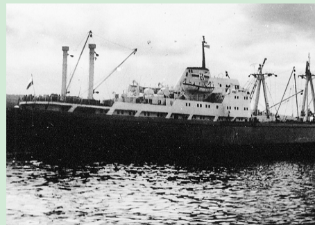
Na statku „Krynica” były książki z Biblioteki w Krynicy.