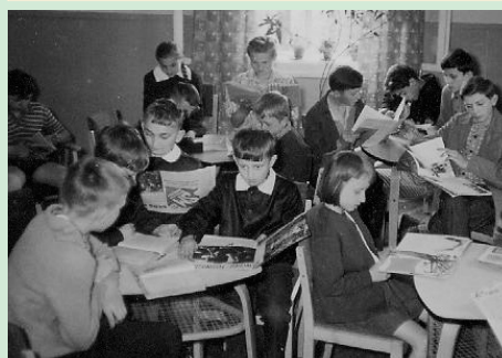
Biblioteka Młodzieżowa w „Cisie” - lata siedemdziesiąte.