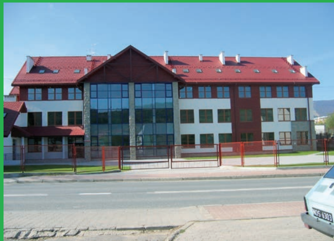
...i nowa. Po wielu latach oczekiwań uruchomiono nowy budynek.

Dziewięć lat temu rozpoczęto budowę nowego obiektu. Dzieci uczą się teraz w pięknym i bezpiecznym obiekcie, który może być wizytówką miasta.