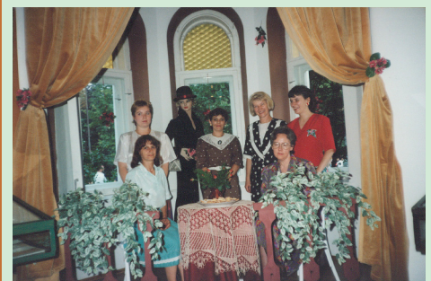
Wystawa „Pamiętki dawnej Krynicy”- 1993r.