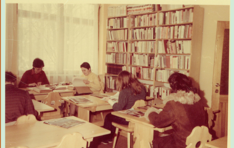
Czytelnia Biblioteki Centralnej, uruchomiona po remoncie budynku w 1983 r.