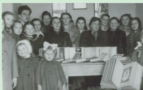
Otwarcie Filii w Krynicy Dolnej 1950 r.