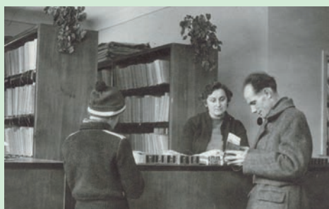
Wnętrze Biblioteki - lata pięćdziesiąte