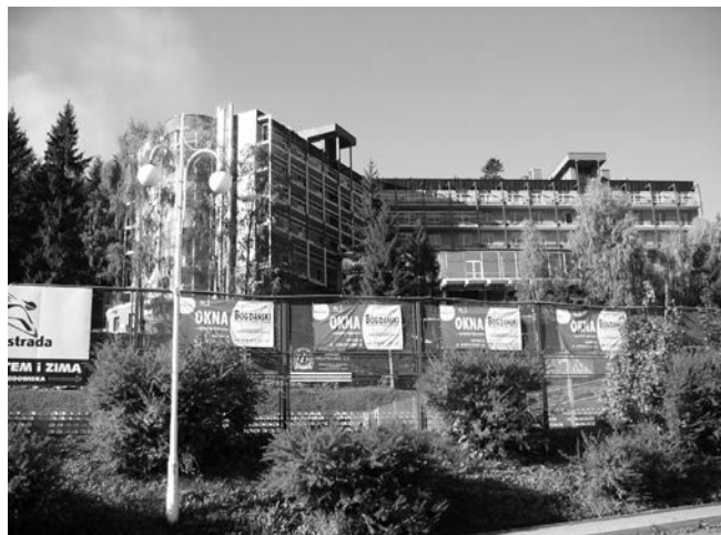
Hotel „Krynica” obok Hali Lodowej.