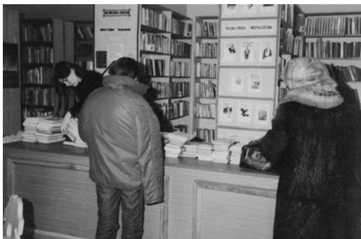
Wypożyczalnia- lata osiemdziesiąte

W 1990 r. zlikwidowana została Filia w Krynicy Dolnej, jej księgozbiór przejęła częściowo Biblioteka Centralna i ponownie utworzony punkt biblioteczny na Słotwinach.