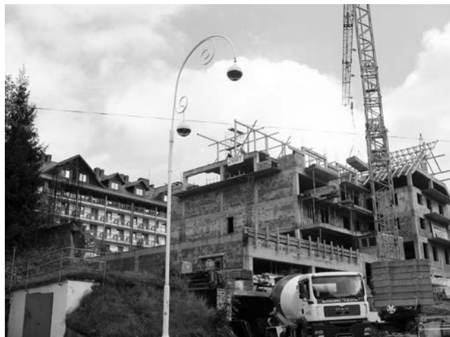
Obiekt przy ul. Leśnej obok hotelu „Motyl”.