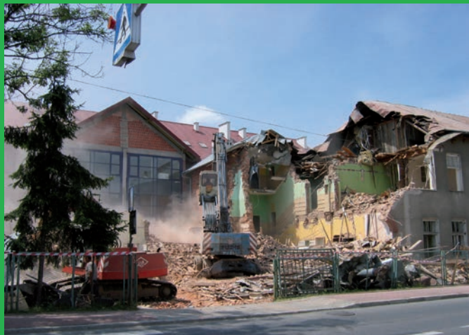
Szkoła podstawowa nr 2 stara...

Dziewięć lat temu rozpoczęto budowę nowego obiektu. Dzieci uczą się teraz w pięknym i bezpiecznym obiekcie, który może być wizytówką miasta.