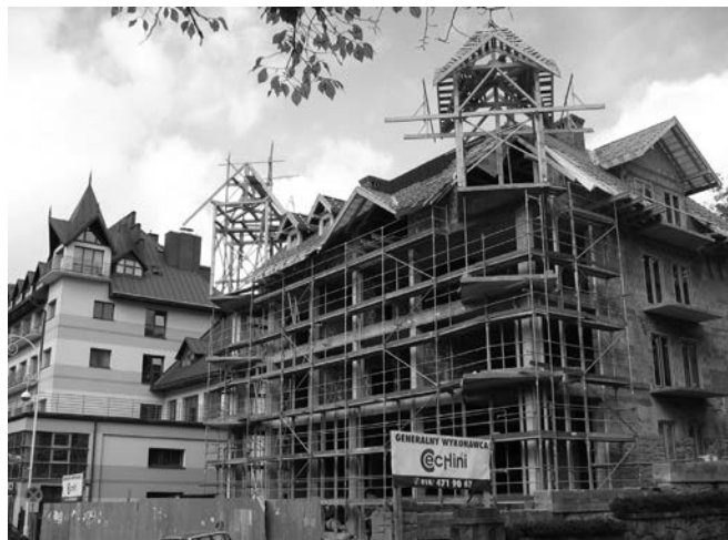
Apartamentowiec ul. Pułaskiego, obok hotelu „Cechini”.

W mieście można zaobserwować ostatnio duży ruch budowlany, powstaje wiele obiektów: hotele, Prezydent przy deptaku "Krynica" obok Hali Lodowej, apartamentowce: przy ul. Kraszewskiego naprzeciw cerkwi w Krynicy Dolnej, przy ul. Pułaskiego obok hotelu „Cechini”, obiekt na ul. Leśnej obok hotelu Motyl i inne mniejsze.