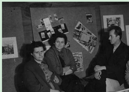
Wystawa „Dawna Krynica” w Nowym Domu Zdrojowym (1960 r.).