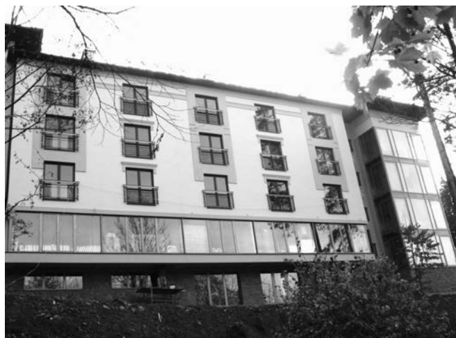
Hotel Prezydent przy Deptaku.