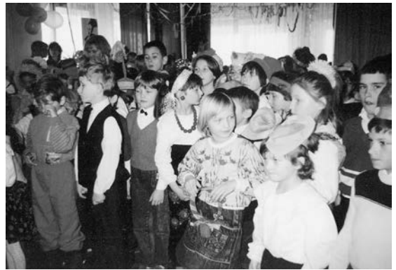
Zabawa karnawałowa dla dzieci

Swoją siedzibę zmieniła też Filia Młodzieżowa, przeniesiona