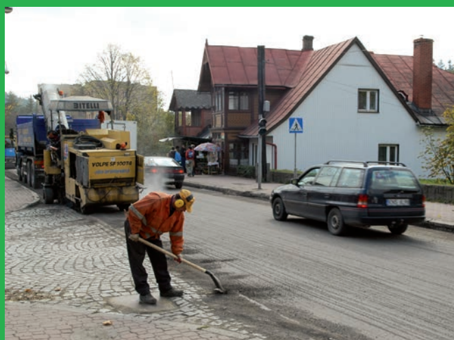
Remont nawierzchni na ul. Piłsudskiego spowodował wiele utrudnień, ale wystające studzienki kanalizacyjne i dziurki w jezdni były bardzo niebezpieczne.